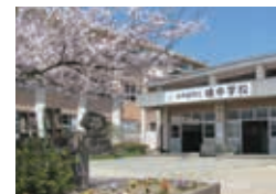
生徒数 264人 (令和2年1月1日現在)

今後も橘中学校は生徒会活動を通じて、自分の生き方をしっかりと考え、自分を取り巻く人々との絆を育んでいこうとする生徒を育てていきたいと考えています。