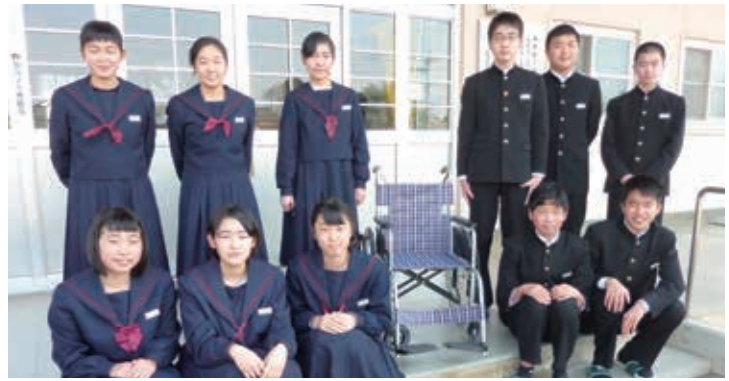
今年度は1台の車いすを地域の事業所に寄贈しました