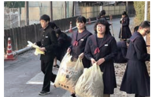
学校周辺のごみ拾いを定期的に行っています

市の東北端に位置し、地域の学舎として140年の歴史を持つ学校です。校区内には九州新幹線「新大牟田駅」もあります。