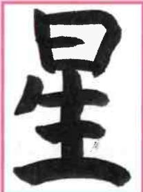
三池小学校 5年 ペンネーム おさら

皆さんから応募して頂いた作品です。今回のテーマは『春』でした。ありがとうございました。作品はすべてえるるに展示しています。