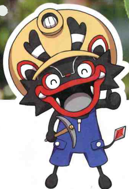
大牟田市公式キャラクター 「ジャー坊」