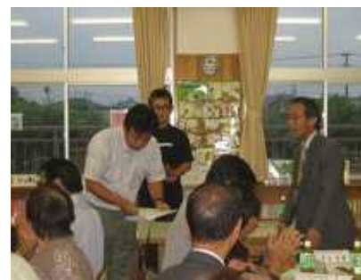
教育長から協議会長への諮問