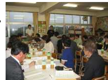
開校のための協議会の協議風景