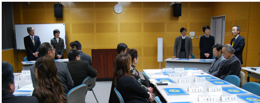
校歌と校章の披露後、 教育長のあいさつを 受ける製作者の皆さん