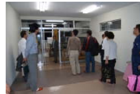
両校の記念品を保管するメモリアルホール