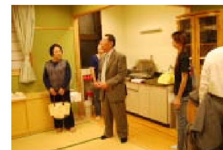
学校・地域連携施設