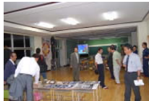
可動間仕切りの多目的教室