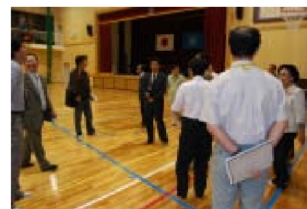
バスケットが2面出来る体育館