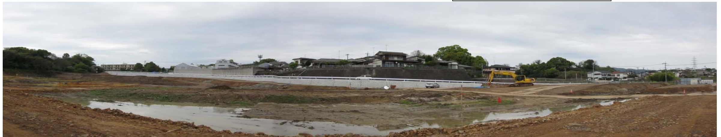
浄水場本体の建設工事環境が整った臼井新町敷地