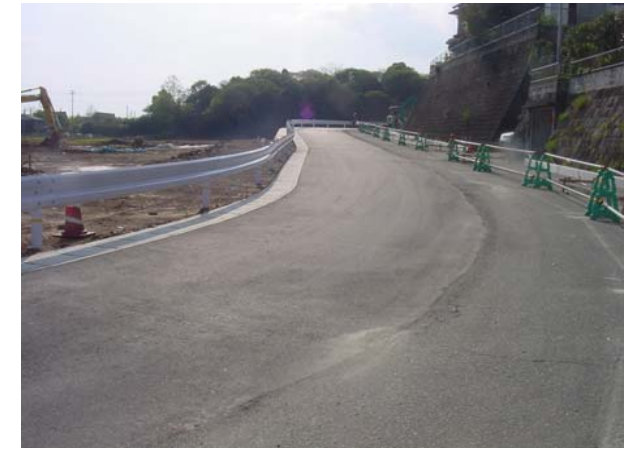
拡がった北側道路