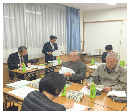
<新制服についての説明>