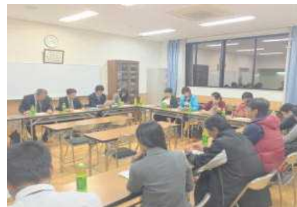
<制服検討委員会の様子>