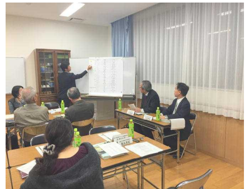
＜開票を見守る協議会委員＞

次回の第7回学校再編協議会では、今回絞り込んだ3案から最終投票を行って、答申する校名案を1つ決定することとしました。