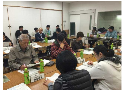
＜投票用紙に記入する協議会委員＞