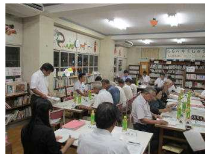
(第4回学校再編協議会の様子)