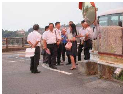
(駛馬橋付近有働資源側道路の視察)

新校の開校までに一定の安全対策を実施していただくために、警察のアドバイスや視察結果をもとにまとめた安全対策の要請書を関係機関に提出します。