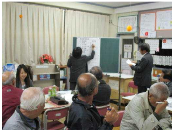
(校名案選考の様子)

投票は、最終案の6案から2～3案に絞るという確認のもと、委員による投票が行われ、得票数が多かった「駛馬」と「はやめ」の2案に絞り込みを行いました。投票結果は以下の通りです。