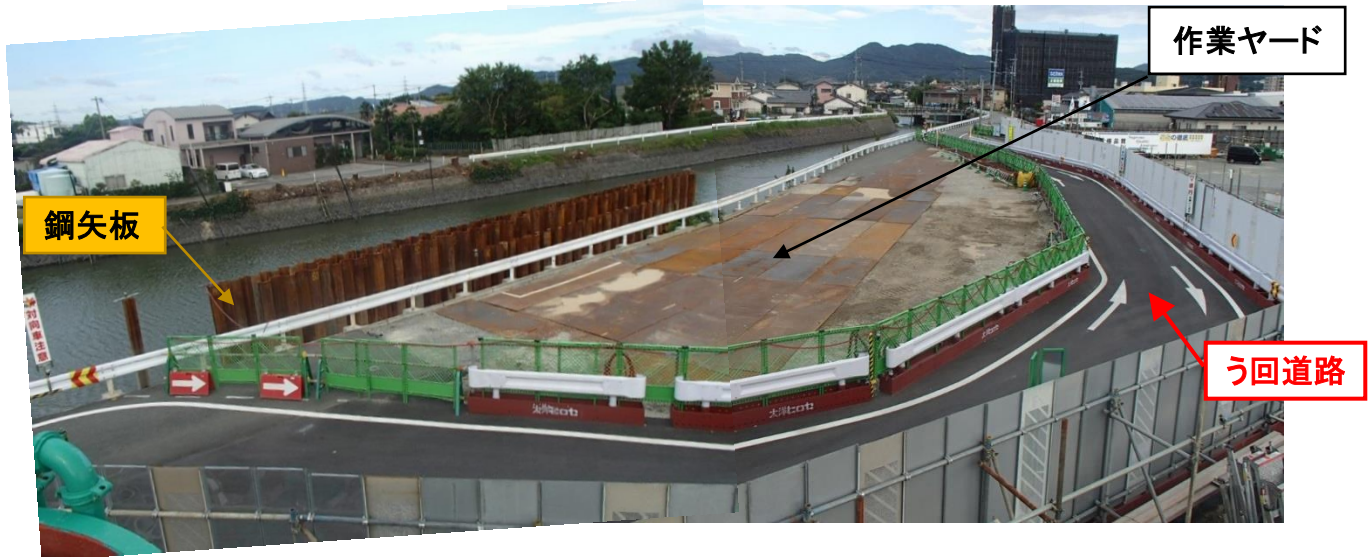
う回道路運用状況と鋼矢板設置状況（9月6日）

※う回道路は安全通行確保のため、大型車及び中型車の通行は基本不可とさせていただきます。ご迷惑をおかけしますが、ご協力をお願いします。