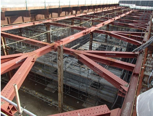
地下部鉄筋型枠状況（9月6日）