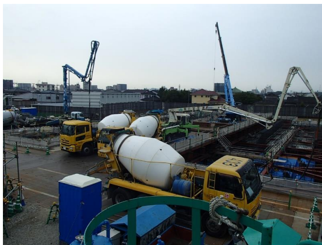
コンクリート打設状況