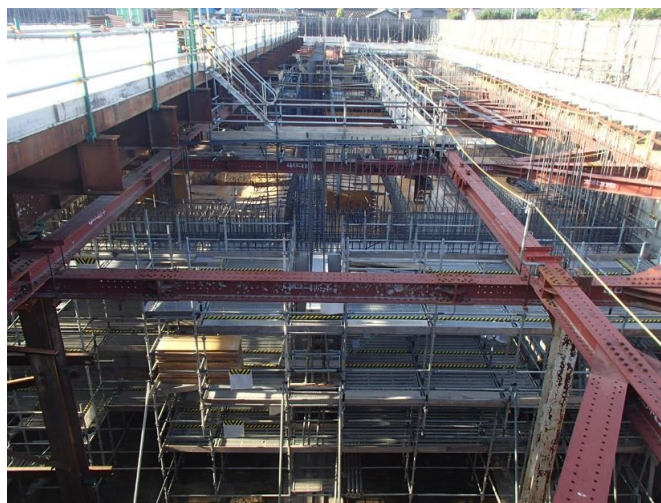
西側仮設材設置状況