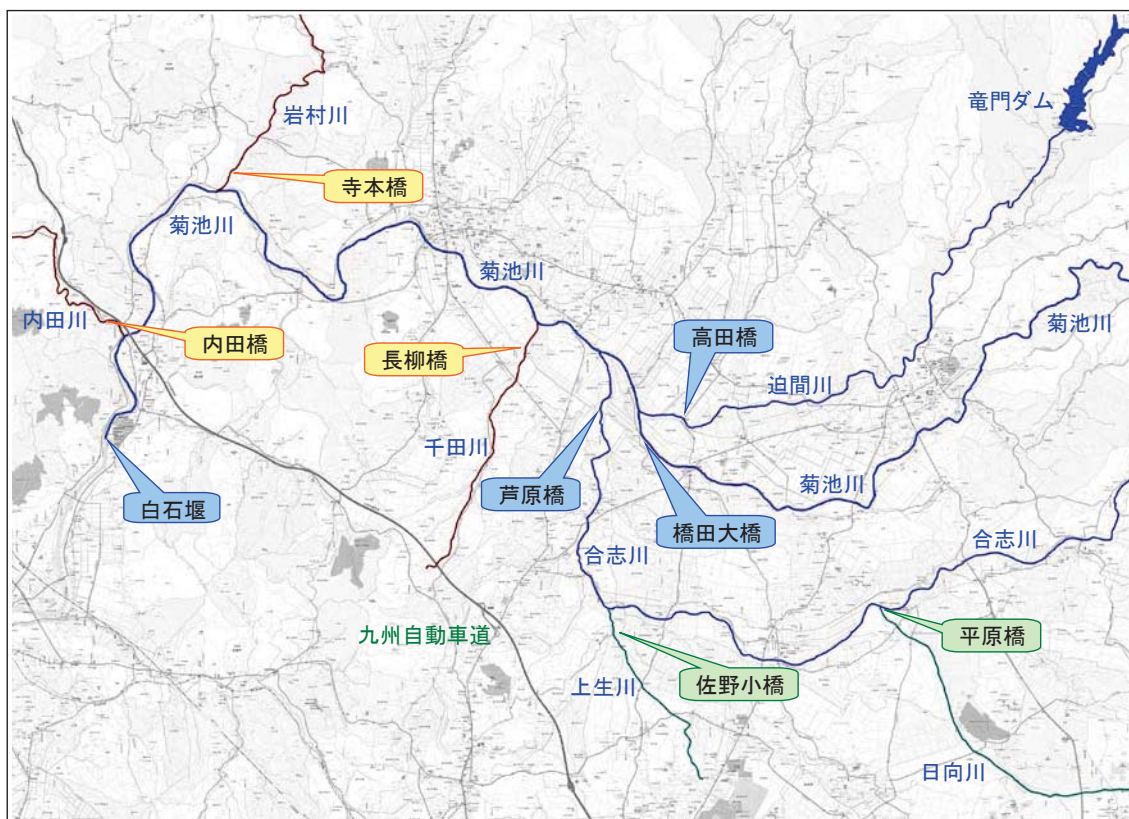
図3 菊池川流域調査における採水地点

なお、本調査の調査項目については、原水水質の状況変化等に応じて年度途中に変更することがあります。