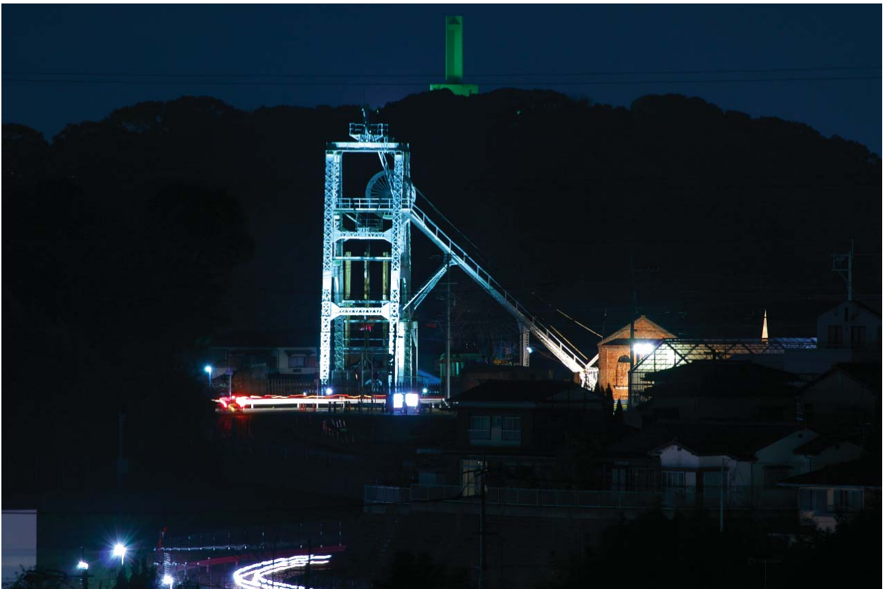
延命配水池と宮原坑