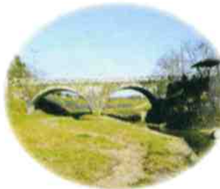
岩本橋(熊本県文化財指定)