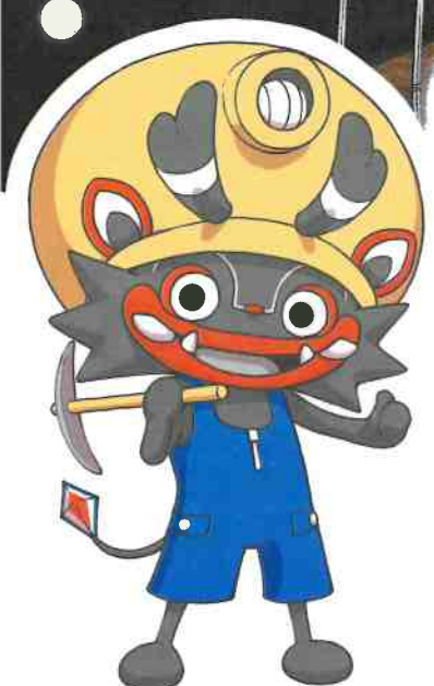
大牟田市公式キャラクター 「ジャー坊」