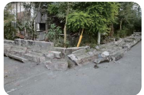
道路側へ倒壊したブロック塀*

熊本地震では数多くのブロック塀が倒壊し、死亡者が出ています。地震時に大きな被害が生じているのは、施工不良や経年劣化によるものと考えられます。不適切なブロック塀が倒れて人の命を奪うことになれば、所有者としての責任を問われる可能性があります。適切な補強や改修を行うことが重要です。