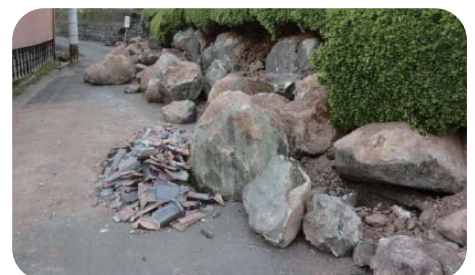
倒壊した石積のよう壁*

熊本地震では敷地を支えるよう壁が倒壊しています。特に石積のよう壁は倒壊した事例が多く、よう壁に近接した建築物の被害が拡大しています。よう壁の構造を鉄筋コンクリート製にするなど、より耐震性のある構造とすることが重要です。