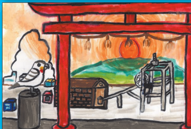
慣れ親しんだ鳥居より (駛馬天満宮)