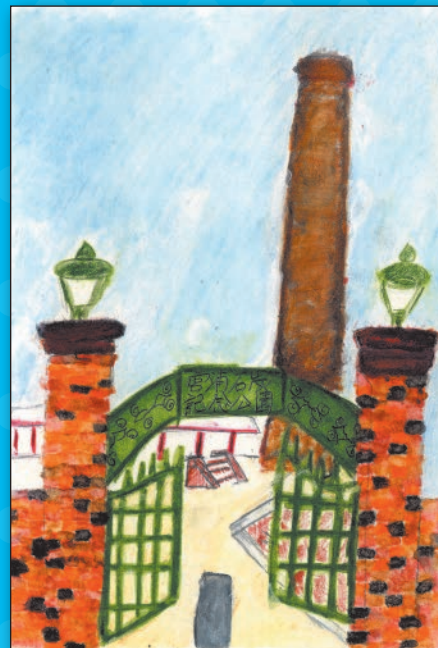
宮浦石炭記念公園