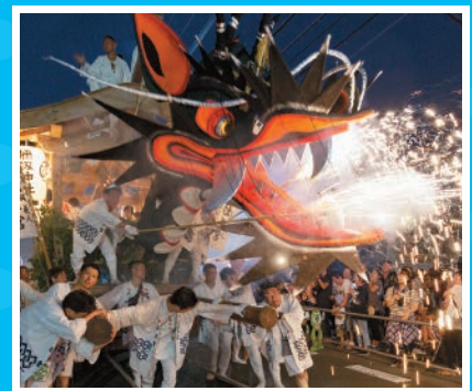
だいじゃやま 大蛇山