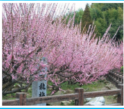
がりゅうばい 臥龍梅