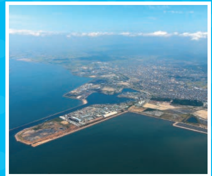
みいけこう 三池港