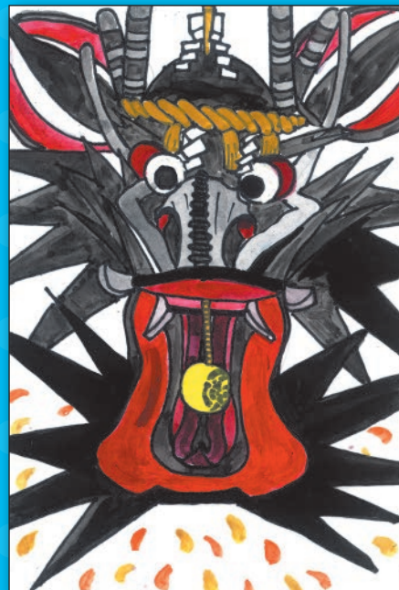
二区の大蛇山 (大牟田神社)