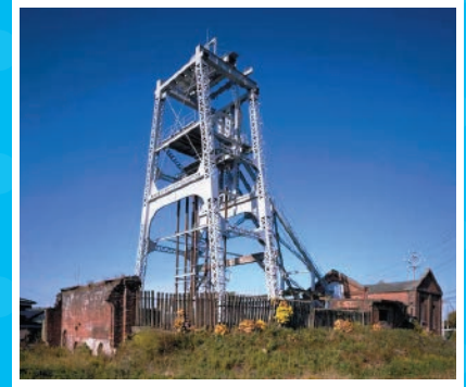
みやのはらこう 宮原坑