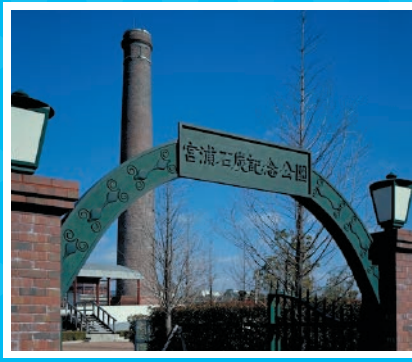
みやうらせきたんきねんこうえん 宮浦石炭記念公園