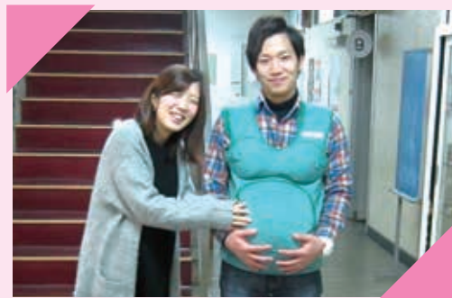
妊婦体験で、ママの気持ちを実感