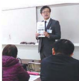
（株）白雲社の終活セミナー

企業や店舗などの従業員が、市民の皆さんのところへ直接出向き、専門的な知識や技術の講義や説明を行います。講座の申し込みは、直接、登録企業へ。