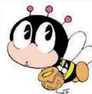
生涯学習のマスコット「マナビィ」

「生涯学習ボランティア登録派遣事業まなばんかん」利用案内と各出前講座メニュー表は、各地区公民館、えるる、市立図書館などの公共施設で配布しています。