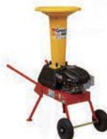
エンジン式 重量約57キロ