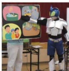
環境問題を楽しく学ぶ講座

市政のことを知りたい市民の皆さんのところへ市の職員が直接出向き、説明や実習を行います。問い合わせ・申し込みは生涯学習まちづくり推進会議事務局(生涯学習課)へ。