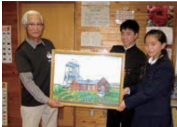
世界文化遺産の素晴らしさを、子どもたちも語り継いでほしい

たくさんの方に喜んでいただき、時には握手されることもあります。そんな時は、おもてなしの心が伝わったんだと、うれしくなります。 一方で、子どもたちにも三池炭鉱関連資産の素晴らしさを語り継いでほしいとの思いで、宮原坑を描いた絵を各校に寄贈することも続けています。現在、10校に渡っていて、市内全校に渡るように、これからも描き続けます。 若い頃から続けていた歌と絵画の趣味が、ガイド活動に生かされていることに何か縁を感じます。これからも一生勉強という思いを持ち、宮原坑、そして大牟田を盛り上げていきたいです。