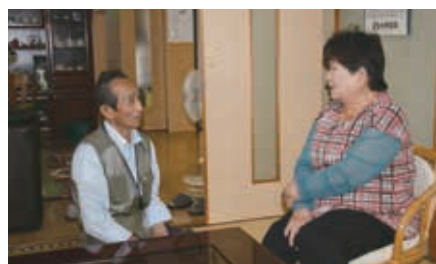
一人暮らし高齢者の見守り訪問活動

改選後の民生委員・児童委員は、 『広報おおむた』12月15日号で お知らせします。