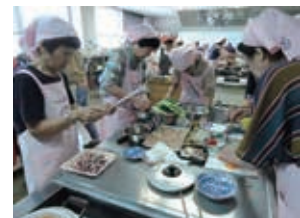
◆協力 大牟田市食生活改善推進員協議会