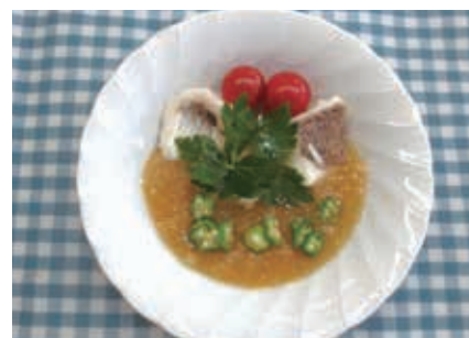
冷やし魚のおろしあん