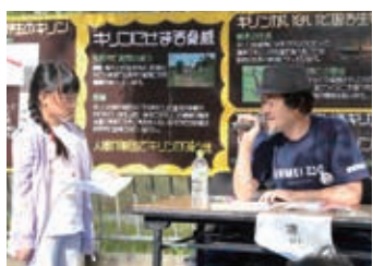
ポエトリーリーディングで、子どもたちに言葉の素晴らしさを伝えます

っています。自分自身大牟田を長い間離れていて、初めてその良さに気付き、2015年に世界遺産に登録されたときに「世界は見ていてくれた。もっとアピールせんともったいなか！」という気持ちがつづり、2017年に大牟田への愛情が詰まった詩集「水の記憶」を発行。続く翌年、大牟田大使に就任し、それからは全力疾走です。動物園でポエトリーリーディング（詩の朗読会）を開催させて頂き、映画にも関わることが出来ました。名誉なことに「いのちスケッチ」というタイトルを命名させて頂きましたが、映画のテーマを伝えつつも、リズム感を大切にしたい、大牟田が世界に羽ばたいてほしいという願いを込めています。 「かつて日本を代表するほど繁栄したまちの文化は素晴らしい。今も世界を照らしてくれている」とみんなに思ってもらえるようになったらうれしいです。まだまだ自分もがんばります。