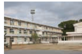
児童数 251 人 (令和元年 11月1日現在)

また、福祉教育にも力を入れており、近くにある特別支援学校の子どもたちや障害のある人との交流を密に行っています。毎年7月に行われる特別支援学校との七夕交流では、宮原中学校の生徒の皆さんと一緒に七夕飾りを作ったり、ゲームなどを楽しんだりして、交流を深めています。実際に言葉を交わし、一緒に行動することで、障害のある人への理解を深め、自分たちにできることを考えます。