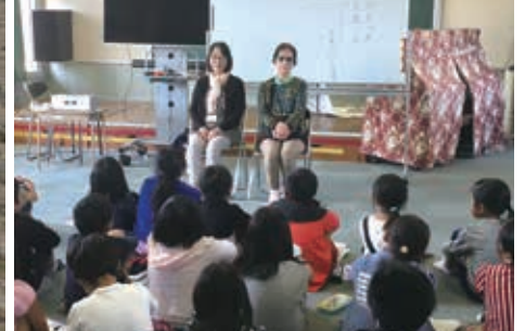
海と川で生物観察を行い、自然の大切さを学びます／福祉教育で、障害当事者の人から話を聞きました