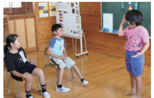
七夕交流で特別支援学校の子どもたちと

平成 25 年に旧天道小と旧笹原小が再編して誕生しました。市の南東部に位置し、校区の一部が荒尾市に接しています。