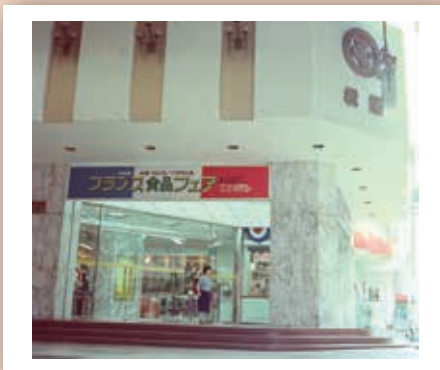
1983年5月の松屋の正面入り口

語り草です。 2004年7月2日に閉店しましたが、食堂の看板メニューであった「洋風かつ丼」は2014年に復刻されて、味わいを取り戻しました。