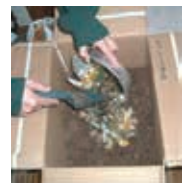
野菜や魚、肉はもちろん、天ぷら油も処理できます