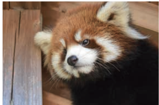
レッサーパンダのレイ