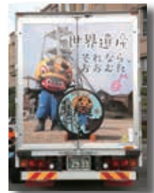
背面には宮原坑とジャー坊が！

奈良市に本社のある富士運輸株式会社が、地域貢献の一環として大牟田市をPRするラッピングトラックを製作・運行することになりました。総重量20トンの大型トラックで、右側面に大蛇山、左側面に大牟田市動物園、背面に宮原坑とジャー坊がデザインされています。同社は、今年7月に大牟田市に支店を開設し「何か大牟田市のためにできることを」と社内でアイデアを募ったところ、ラッピングの話がでたそうです。11月25日には本庁舎前で出発式が行われ、天領保育所の園児がジャー坊体操を披露し、テープカットで完成を祝いました。ラッピングトラックは今後、関東・関西など全国を走行します。