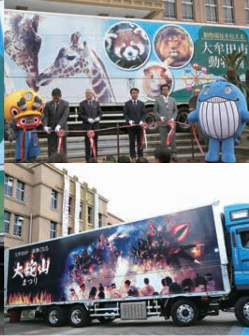
長さ約10m、幅約2.5mの大迫力のデザイン。出発式の後、工業製品などを積んで大阪方面へ向かいました