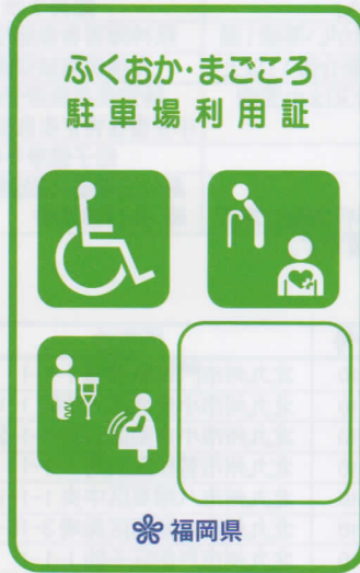
緑色 (身体・知的・精神障がい者、高齢者、難病者)

赤色の利用証は、車椅子常時利用の身体障がい者で、自ら運転する方に交付しています。幅の広い駐車場が必要な方となりますので、ご配慮をお願いします。