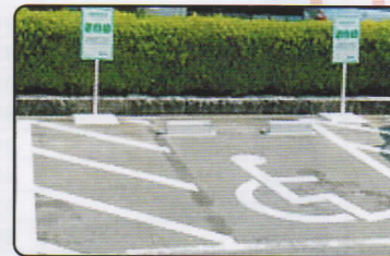
目印ステッカーが掲示してあるスペースで利用できます (A3サイズ)