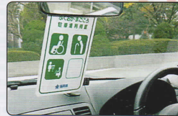
利用証をルームミラーに掛けて使用します