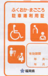
オレンジ色 (妊産婦、けが人)