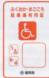
赤色 (車椅子常時利用の身障者で自ら運転)