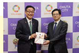
※寄附金贈呈式イメージ

ご希望に応じて、大牟田市への寄附贈呈式を実施いたします。 メディアへの情報提供も行いますので、御社やご寄付に関するアピールが可能です。