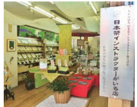
上/日本茶インストラクターとして、お茶の普及活動にも努めています 左/時代に合わせた工夫をしています(ティーバッグ機械導入)