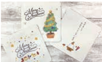
手に取りやすい価格・デザインには「日本茶を好きになってほしい」との思いが

そこで、急須がなくても日本茶の香りや味を楽しめる好みに応じた「ティーバッグ」が大変喜ばれています。