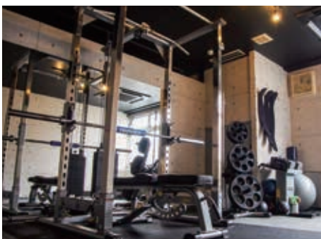
誰の視線も気にすることなく、トレーナーとマンツーマンで頑張ることができる完全個室のトレーニングルーム。

僕自身が変われたから 誰もが新しい自分になれることを みなさんに発信していきたいんです。