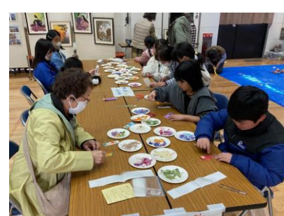
▲「押し花でしおり作り」世界で一つだけのオリジナルが完成