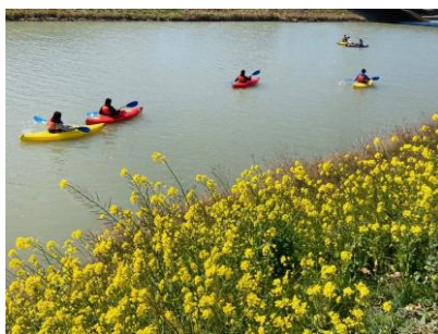
▲満開のなの花を背にカヌー乗船を楽しみました