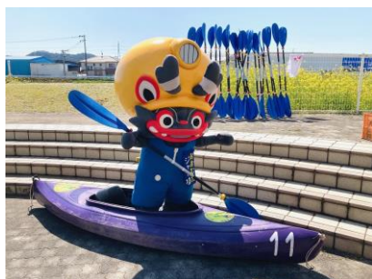
▲オープニングにジャー坊が登場。カヌーにも挑戦!?

令和6年3月9日(土)午後1時から、「2024なの花フェスタ」が駿馬地区公民館と周辺を会場に開催されました。当日は時折、少し冷たい風が吹きましたが、良い天気で、会場内はにぎわいました。