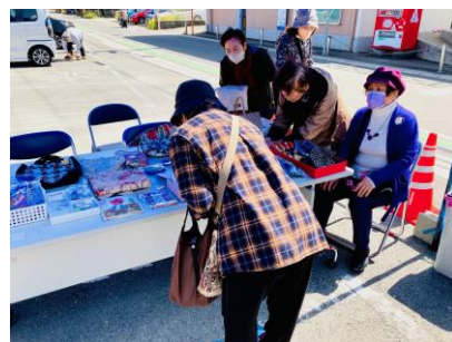
▲バザーでは、サークル活動の成果(手芸作品)も販売