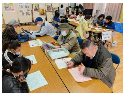
▲郷土クイズではサークル会員が分かりやすい解説