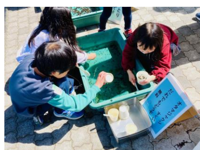
▲「生き物と遊ぼう」コーナー楽しみながら生態を観察