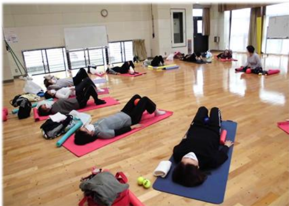
講座「シニアピラティス♪足から整えて楽しく健康 づくり」を開催しました(アクティブシニアデビュー 塾)。講座終了後はサークルが立ち上がりました。