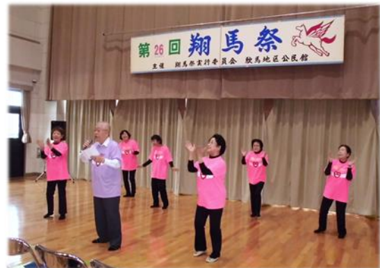
サークル連絡会の文化祭「翔馬祭」が3年ぶりに開催され ました。日頃の学習の成果を披露しました。[8日、9日]