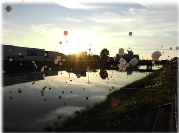
はやめカッパ祭りが3年ぶりに開催されました。川辺に 浮かぶスカイランタンは皆を魅了しました。[1日]