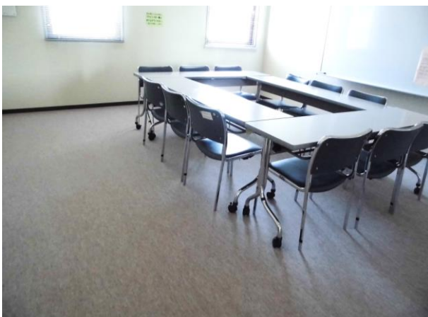
▲カーペット張替え