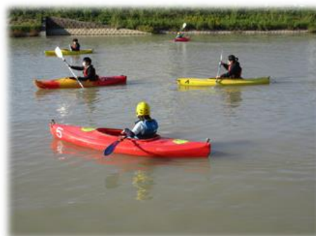
「ふれあいカヌー デー」を開催しま した。[29日]