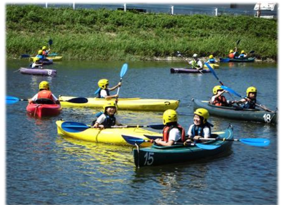
駿馬小3年生と4年生の「生き物教室」と 「カヌー乗船体験」の支援をそれぞれ行い ました。[1日:4年生][7日:3年生]