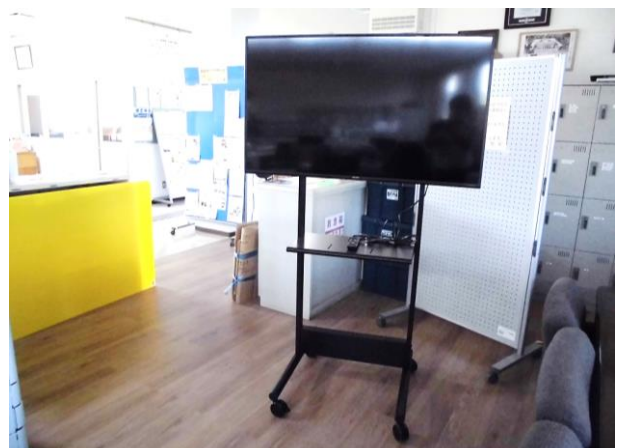
▲大型モニター(キャスター付きで移動可)