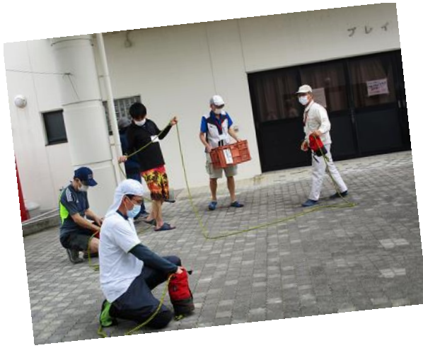
カヌーサポーター養成講座を開催しました。 [27日]