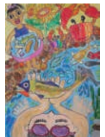
安藤 士稀さんの作品