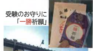
受験のお守りに「一勝祈願」