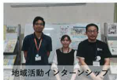
地域活動インターンシップ

16日 子どもの居場所 スタート 19日 天領校区盆おどり大会 地域活動インターンシップスタート(大牟田市職員) 28日 ホークス観戦チケット配布