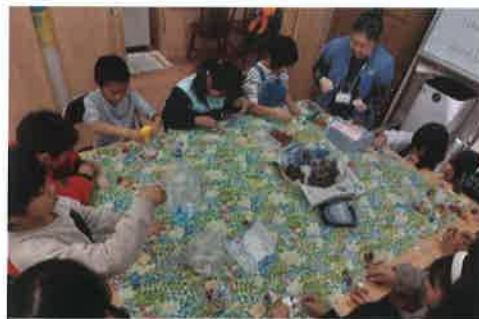
クリスマス松ぼっくりツリー作り

令和5年8月16日からスタートした子どもの居場所は現在までに延べ200人超の子ども達が遊びに来てくれています。 毎週水曜日の放課後、かおみしりに行けば誰かと会える！そんな地域の中の気軽に立ち寄れる場所を目指しています。地域のみなさんの気軽に覗きにきてください。 毎週水曜日 14時~17時(第三水曜は15時~17時)