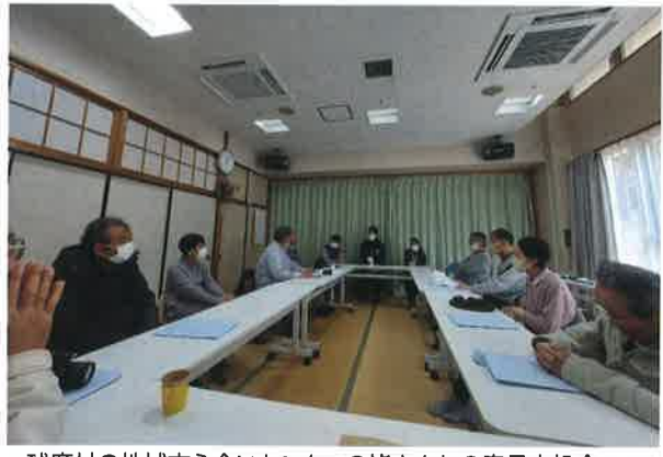
球磨村の地域支え合いセンターの皆さんとの意見交換会。勤めていた介護事業所が災害で閉鎖になったため、支え合いセンターの職員に転身された方もいらっしゃいました。