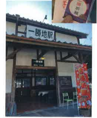
縁起の良い名前の駅が観光の拠点になっていました。球泉洞も復活しているので、春のお出掛けにいかがですか？