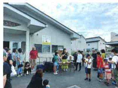
9/30・10/1 敬老の日「元気と笑顔をお届け大作戦」