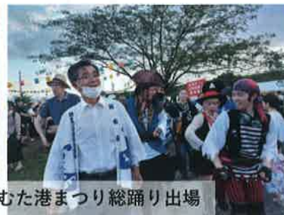
第61回おおむた港まつり総踊り出場