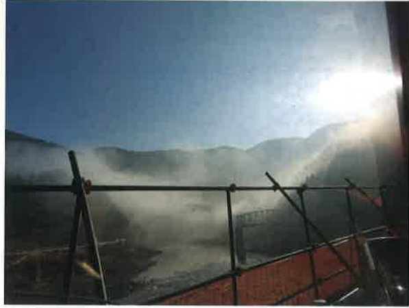
球磨川を上って行くと、至る所に工事中の場所があります。