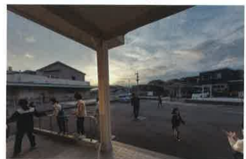
すぐに鬼ごっこが始まります。