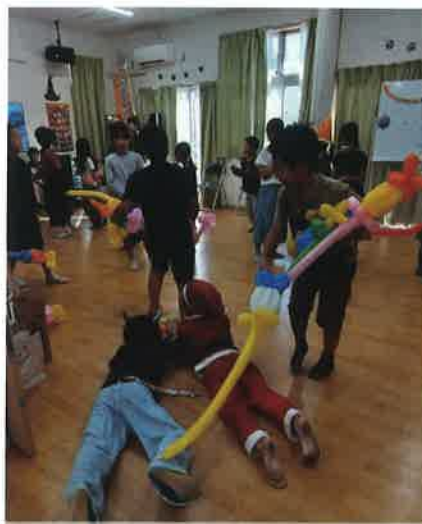
10月ハロウィンスペシャル

令和5年8月16日からスタートした子どもの居場所は現在までに延べ200人超の子ども達が遊びに来てくれています。 毎週水曜日の放課後、かおみしりに行けば誰かと会える！そんな地域の中の気軽に立ち寄れる場所を目指しています。地域のみなさんの気軽に覗きにきてください。 毎週水曜日 14時~17時(第三水曜は15時~17時)