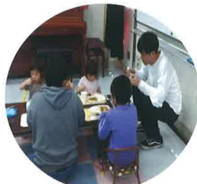
お父さん、足・・・ しびれませんか？

甘木中学校は、正門を入ると、中央階段に描かれた「スマイル甘木」が目に入ります。この絵には、大きな声であいさつをかわし、笑顔と笑い声にあふれた学校にしようと願いを込めて、平成十年に生徒会によって制作されました。