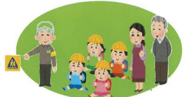
新1年生下校見守り… 4月11日、12日