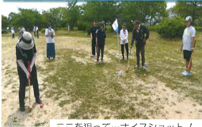
ここを狙って…ナイスショット！