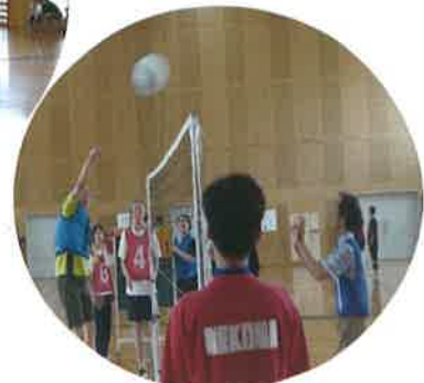
ネットぎわの攻防戦