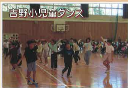
吉野小児童ダンス