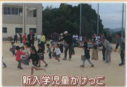
新入学児童かけっこ