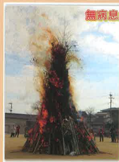
無病息災・五穀豊穡の火祭り