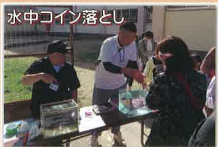
水中コイン落とし