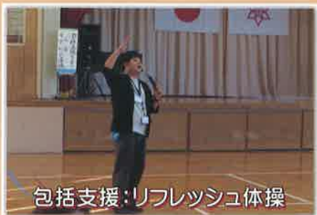
包括支援：リフレッシュ体操