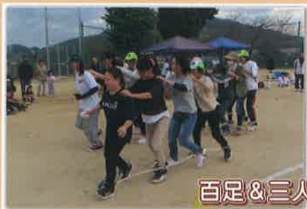
百足&三人四脚リレー