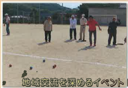
地域交流を深めるイベント!