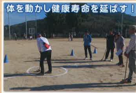
体を動かし健康寿命を延ばす!