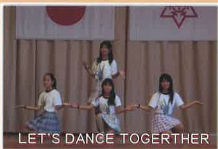
LET'S DANCE TOGETHER