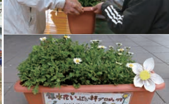
地域の人に教わりながら花壇の整備、種もみ、水やり、草取り、植え替えなど責任を持って育てます／立派に育った絆の花を地域の人に渡しました