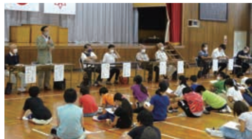
地域の人が、学校やまちのためにしている活動のこと、どんな思いでその活動をしているのか直接聞きました

明治9年創立の歴史ある学校です。市の北東部に位置し、小学校区内の人口は市内最多であり、在籍児童数も非常に多い学校です。