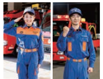
この制服が支給されます