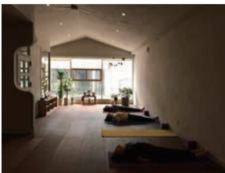
自然素材が心地よい、安心安全な環境づくりにこだわった居心地の良いスタジオ。