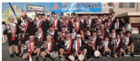
大蛇山まつりへの参加も毎年の恒例行事

世界でも一目置かれる日本のものづくりですが、ものづくりはまず「設計する」ことで成り立っています。例えばプラモデルを組み立てるとき、設計図を見ますよね。設計図は何かを作るときに教科書のような役割を持っており、社員には創造性のある高い技術と作業の速さなどが求められます。