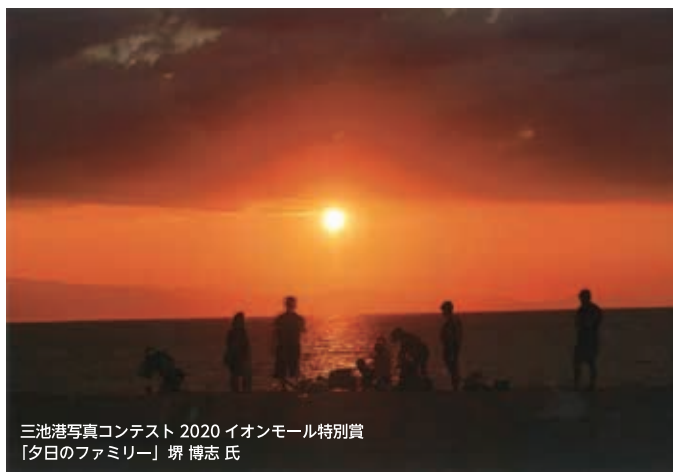
三池港写真コンテスト 2020 イオンモール特別賞 「夕日のファミリー」堺 博志氏