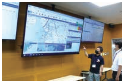
防災専用ネットワークシステム