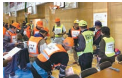
地域住民による避難所運営訓練