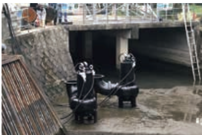
ポンプが増強された三川ポンプ場