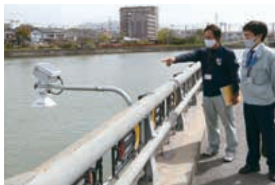
諏訪川と船津新川の合流地点に設置された水位計