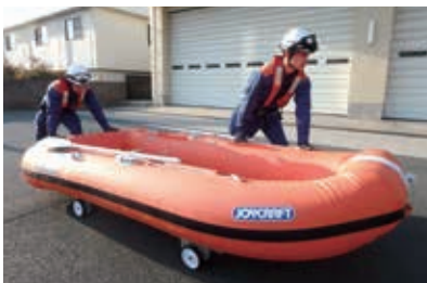
追加配備されたボート