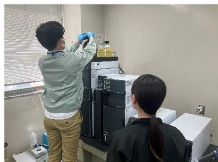
分析支援 (食品成分マルチ分析システム)