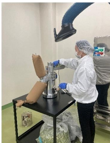
加工支援 (ハンマーミル)

福岡県工業技術センター 生物食品研究所 食品課 TEL 0942-30-6215