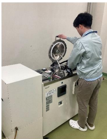
加工支援 (レトルト殺菌機)