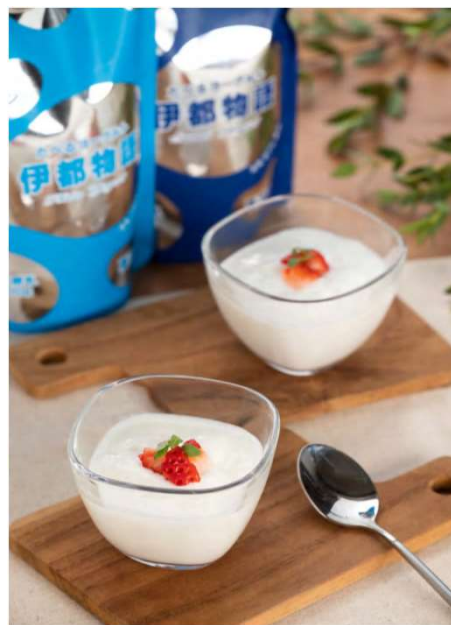
令和4年度ふくおか6次化商品セレクションで県知事賞を受賞した 築上きいもふりかけ(左)と伊都物語たべるヨーグルト(プレーン・加糖)(右)