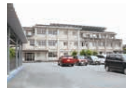
生徒数 115 人 (令和3年10月1日現在)

遠くに三池山や高取山を望む中で、ひまわりのように、あかるく、たのしく、げんきよくをモットーに学校生活を送っています。