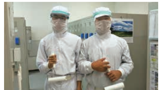
一般企業等での実習では貴重な経験ができました

遠くに三池山や高取山を望む中で、ひまわりのように、あかるく、たのしく、げんきよくをモットーに学校生活を送っています。