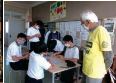
宮原坑観光ガイドの方をゲストティーチャーに招き、宮原坑の貼り絵を作成しました