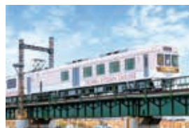
THE RAIL KITCHEN CHIKUGO