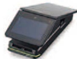
キャッシュレス決済端末