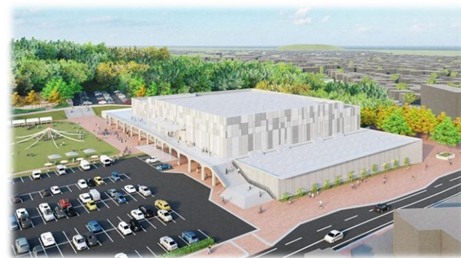
※ (仮称) 総合体育館 基本設計時イメージ