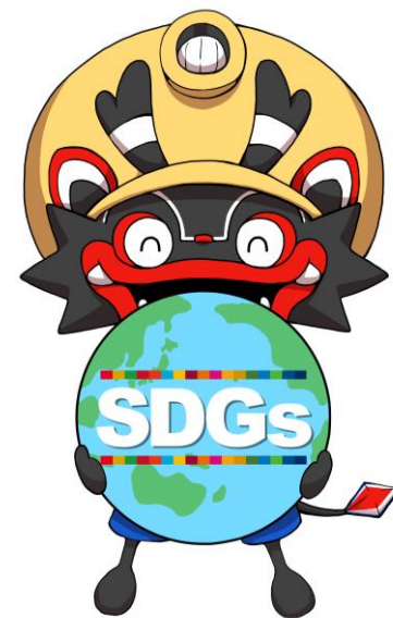
大牟田市公式キャラクター 「ジャー坊」

※平成13年度（616億6千万円）、平成12年度（604億8千万円）に 続く過去3番目の大型予算