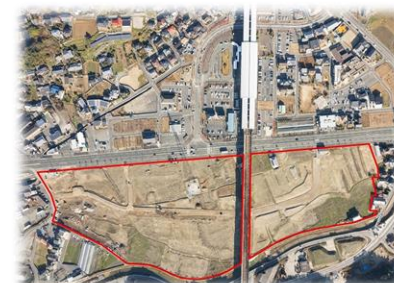
※ (仮称) 新大牟田駅南側産業団地整備予定地