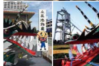
1. 配管機器のバルブ（開閉弁）という機械。主に液体の流れを調整する時に使用します。納品前は念入りにチェックします。産業機械器具は繊細な製品も多いので、扱いには注意が必要です。2. 大正町の大通りにある本社の外観。東京と大阪に支店があり、岩国と北九州に営業所があります。3. 事務所内の様子。4. ミーティング風景。5. 社会貢献の一環で、世界遺産の宮原坑や学校、福祉施設に大蛇山を展示しました。