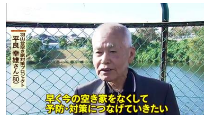
地元テレビ局の番組に出演しました