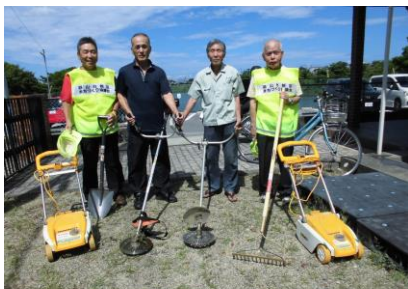
草刈代行サービス開始しました