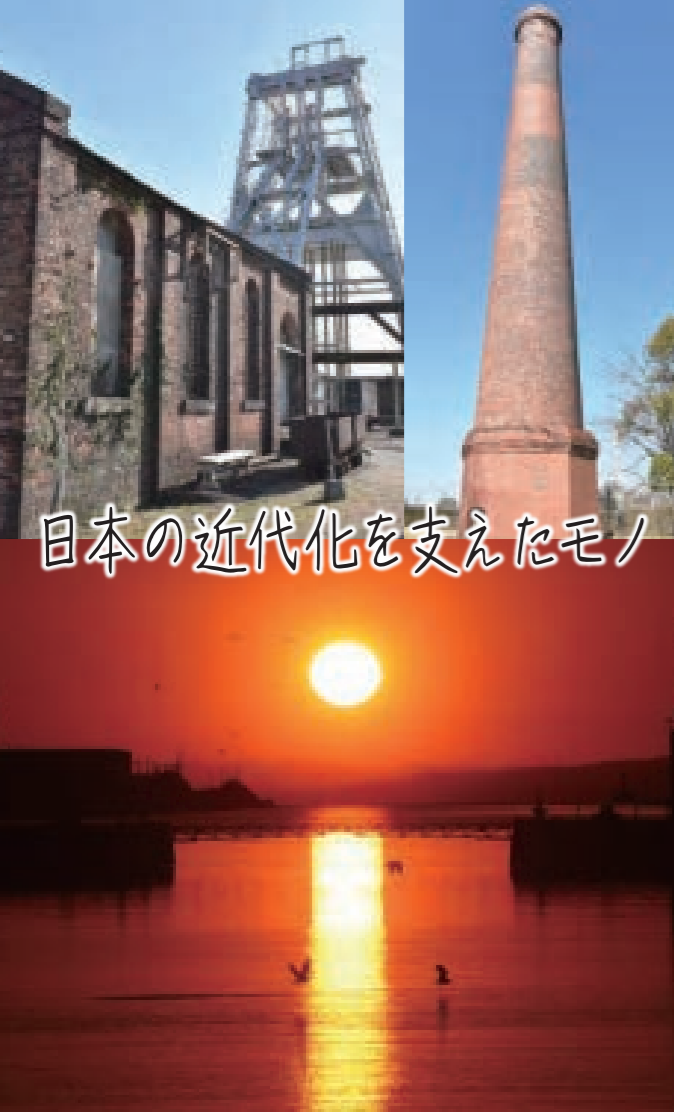
日本の近代化を支えたモノ