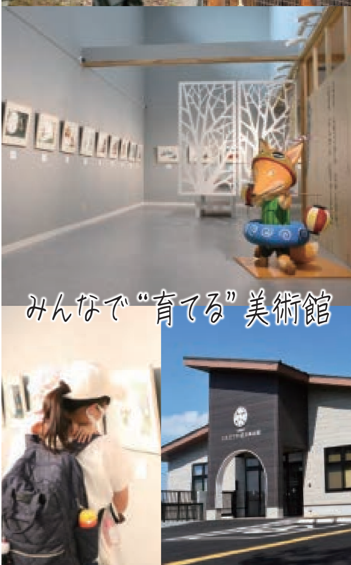
みんなで“育てる”美術館

発行：大牟田市 観光おもてなし課 大牟田市有明町2丁目3番地 TEL 0944-41-2750 FAX 0944-41-2764 e-kankoomotenashi01@city.omuta.fukuoka.jp https://www.city.omuta.lg.jp