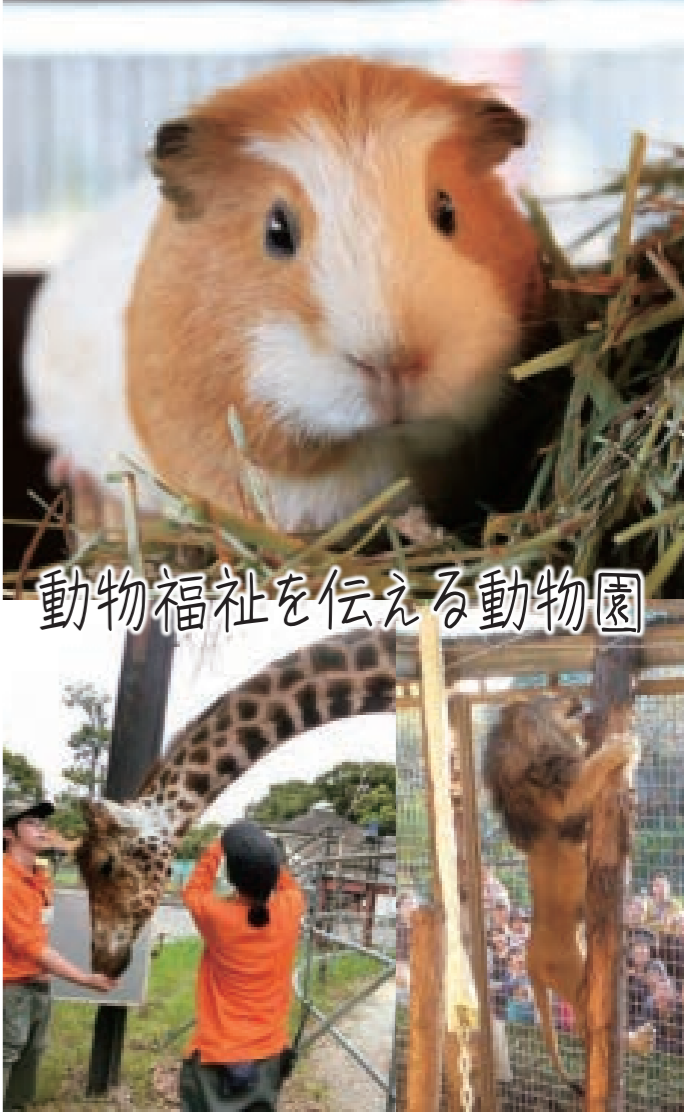
動物福祉を伝える動物園