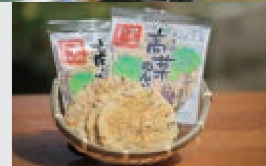
大牟田限定販売の「高菜めんべい」。三池高菜を生地に練り込み、ピリリと辛い味付けはおつまみにもピッタリ。