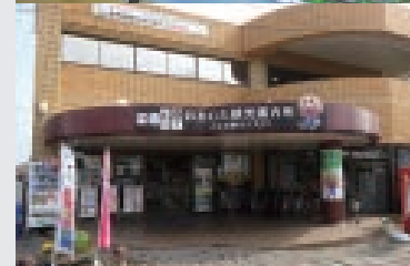
大牟田駅東口を出てすぐの建物。ジャー坊の看板が目印です。