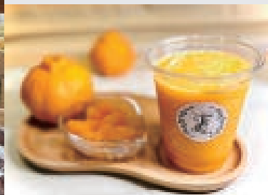
館内のカフェ「flure」で提供されているスムージー。新鮮なフルーツがそのまま味わえる。