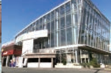
ガラス張りが目を引く建物は、太陽光を取り込み、館内はとても明るい。