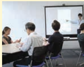
ソフトバンク ゆめタウン大牟田 大牟田日出町(㈱エム・ティ・ネット) 「初めてさわるスマホ塾」