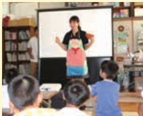
久留米ヤクルト販売㈱ 「ウン知育教室」

企業や店舗などの従業員が、市民の皆さんのもとへ直接出向き、専門的な知識や技術の講義・説明を行います。