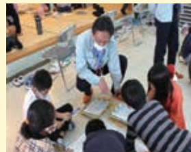
防災危機管理室 「災害図上訓練～防災を みんなで考えよう～」