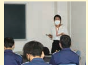
市立病院 「症状がないから怖い… 高血圧・糖尿病・脂質異常症」