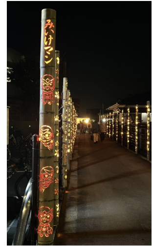
会場入り口に飾られたみいけマンの竹のオブジェ（7年三池光竹にて）

昨年の三池光竹ではみいけマンのオブジェも登場しました。これからも地域に愛されるキャラクターとしてたくさんのヒーローを探しに出かけます。