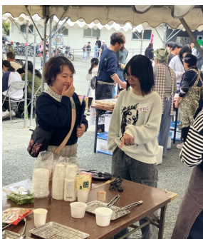
地域のイベントにて

居場所には、お年寄りの方にお茶を飲みに来てもらうだけでもいいです。みんなの居場所となり、地域の安心・安全の場所になることが理想です。