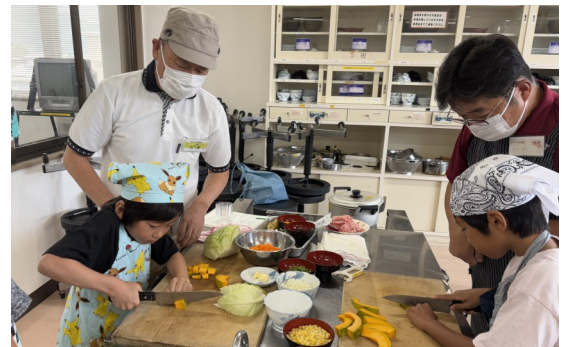
昨年の子どもの体験の様子

今年の夏休みも小学生を対象にした体験講座を実施します。料理や書道、竹細工、絵手紙など、公民館サークルやボランティアの方々に教えてもらいながら楽しい体験ができます。夏休みの思い出づくりに参加しませんか。詳しくはチラシやホームページでお知らせします。