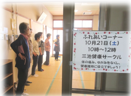
操体法の体験コーナー♪