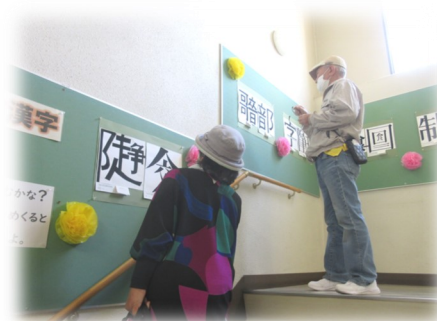
文字をデザインした歴木中の生徒の作品は脳トレにピッタリ！