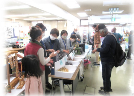
初めて販売したクッキーとコーヒーはあっという間に完売！