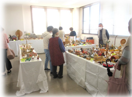
まるで本物みたいな「郷土玩具の会」の皆さんの作品の数々！