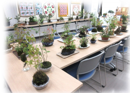
沢山の苔玉が会場を賑わせています♪

三池地区公民館では、様々なサークルが活動しています。興味がある人は、気軽に三池地区公民館まで問い合わせてください。(☎53-8343)