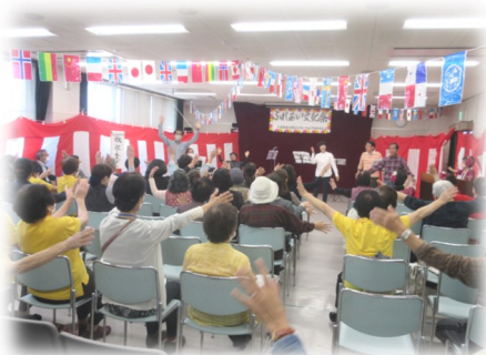
会場の皆さんも一緒に♪

演芸や展示では、日頃のサークル活動での練習や作品作りの成果を発表され、大変盛況でした。